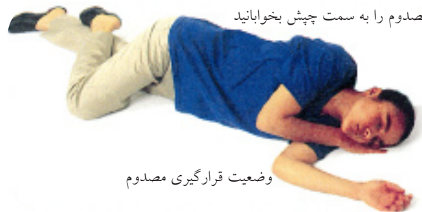
وضعیت قرارگیری مصدوم